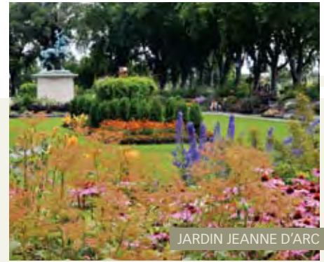
JARDIN JEANNE D'ARC